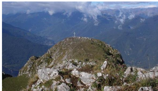
Le pic Saillant vu du pic du Gar

Monter à travers ce pâturage jusqu'au col entre le pic du Gar et le pic Saillant. Une source est visible au 2/3. Les plus courageux feront les deux pics.